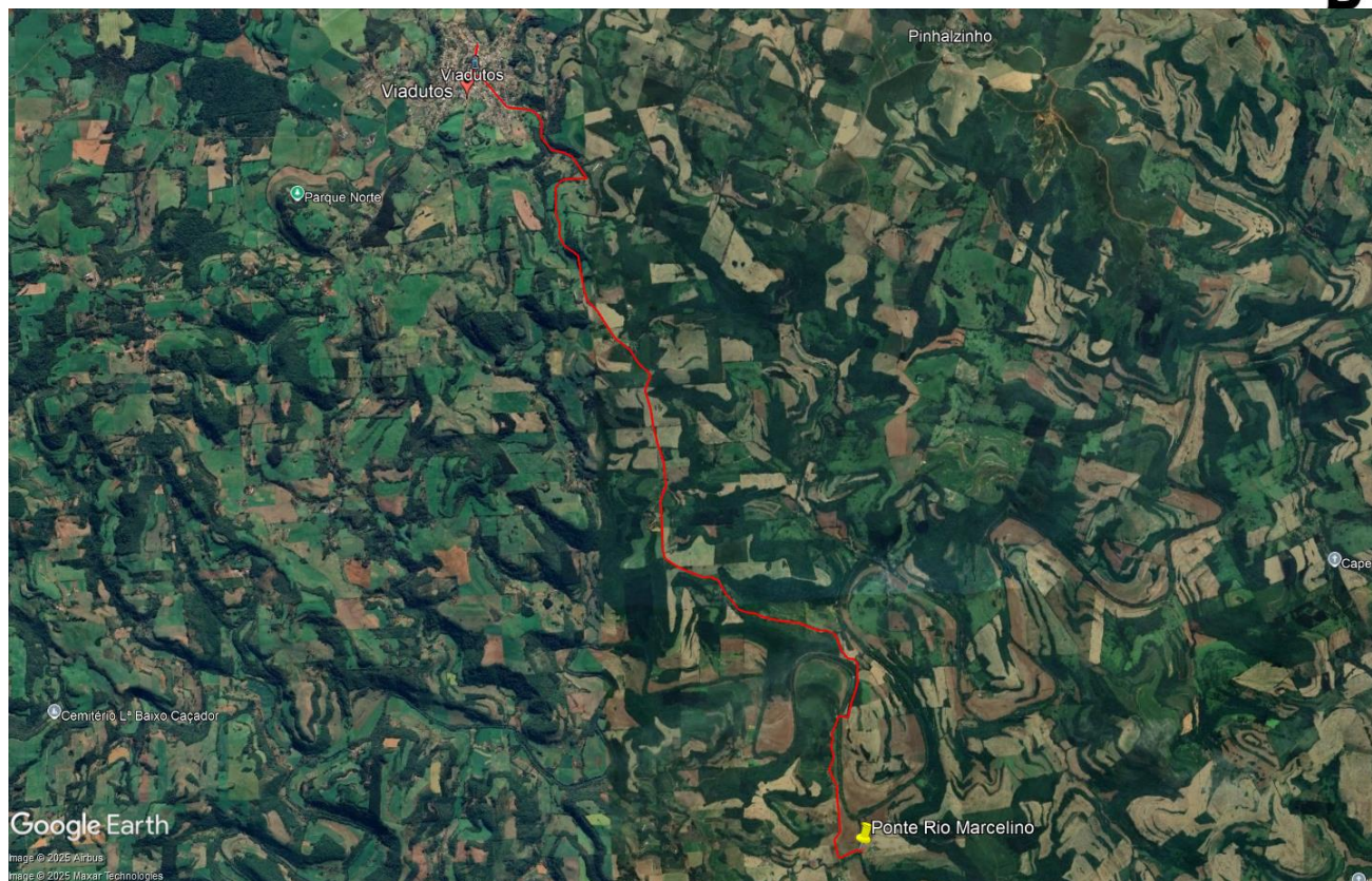
Imagem 01: Croqui de acesso ao local

O local de estudo se localiza a aproximadamente 13,8km de distância da prefeitura municipal de Viadutos, sendo acessada através da RS 331 e posteriormente seguindo a direita por estrada vicinal em direção a comunidade da Linha Rio Marcelino por mais 11,00km, seguindo a esquerda na estrada que dá acesso à outras comunidades, chegando na referida ponte, conforme apresentado na imagem 01 acima.