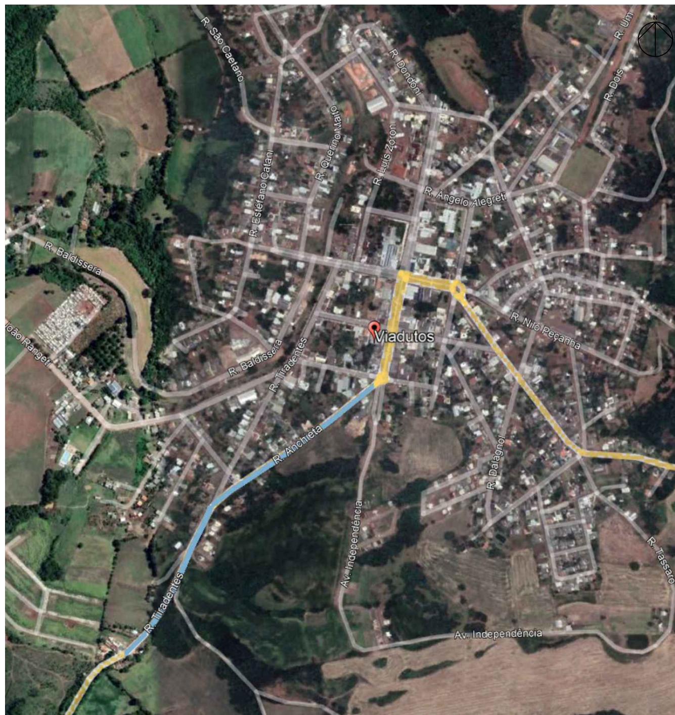
LOCALIZAÇÃO - GOOGLE EARTH - sem escala