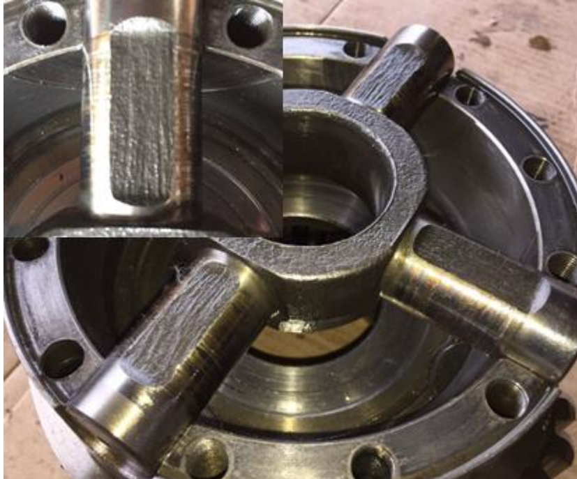
Figura 2 - Cruzeta

A cruzeta da caixa satélite apresenta excessivo desgaste nos locais de montagem das planetárias. Componente precisa ser substituído.